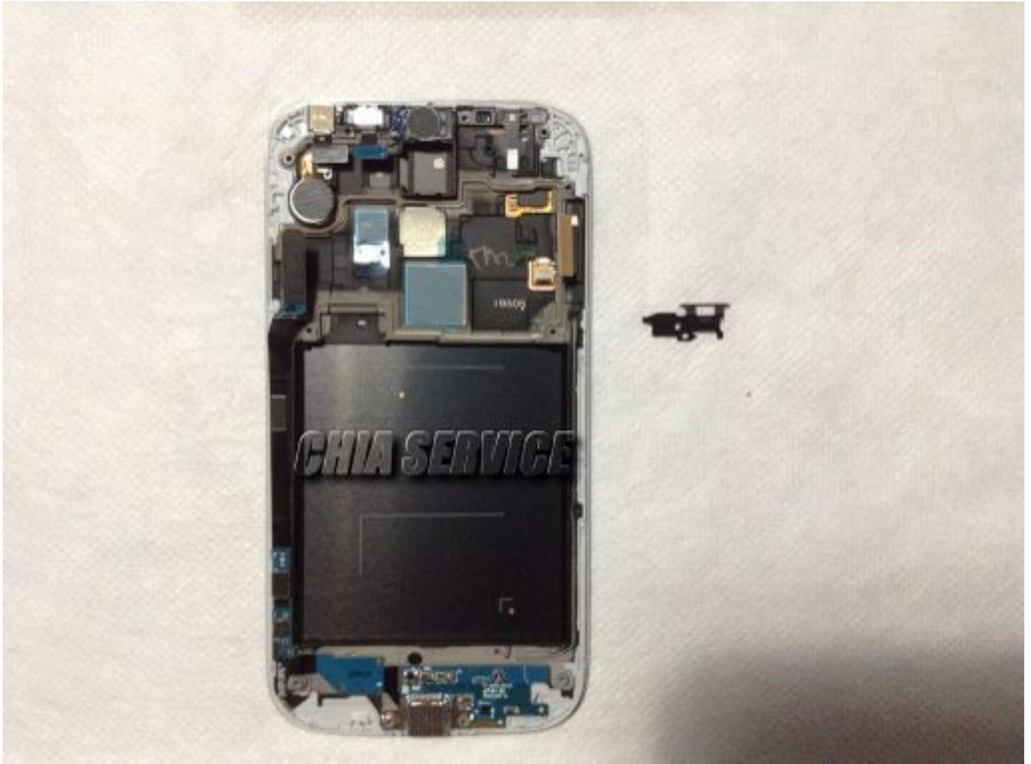
Rimozione della fotocamera Frontale.